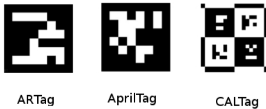
Рис. 1. Маркеры ARTag, AprilTag, CALTag (слева направо)

условиям, большинство маркеров сделаны монотонными [Hirzer, 2008]. ARTag, AprilTag, и CALTag системы имеют две стадии обнаружения тегов: поиск и детектирование уникальных особенностей (англ. unique features) и распознавание тега [Fiala, 2005a]. На первом этапе системой обнаруживаются особенности тега - квадратная форма и четыре угловые точки. На втором этапе проверяется внутреннее изображение для определения, является ли обнаруженный объект тегом или нет. Различный дизайн маркеров, алгоритмы обнаружения и распознавания влияют на сильные и слабые стороны тегов в различных ситуациях. Для оценки тегов существует несколько критериев: устойчивость к окклюзии (полное или частичное перекрытие тега другим объектом), устойчивость к изменению освещения, вероятность ошибочного принятия одного маркера за другой, минимальные размер маркера (или максимальное допустимое расстояние до маркера), и ложный/негативный эффект и другие [Fiala, 2004]. На рисунке 1 изображены примеры маркеров ARTag, AprilTag и CALTag.